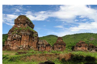
★ Di Tích Mỹ Sơn ★ 8,000¥/1 người