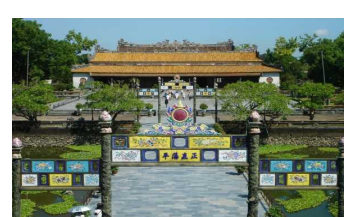
★ Cố Đô Huế ★ 16,000¥/1 người