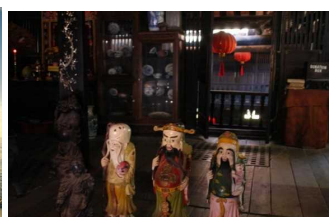
★ Phố cổ Hội An ★ 6,500¥/1 người